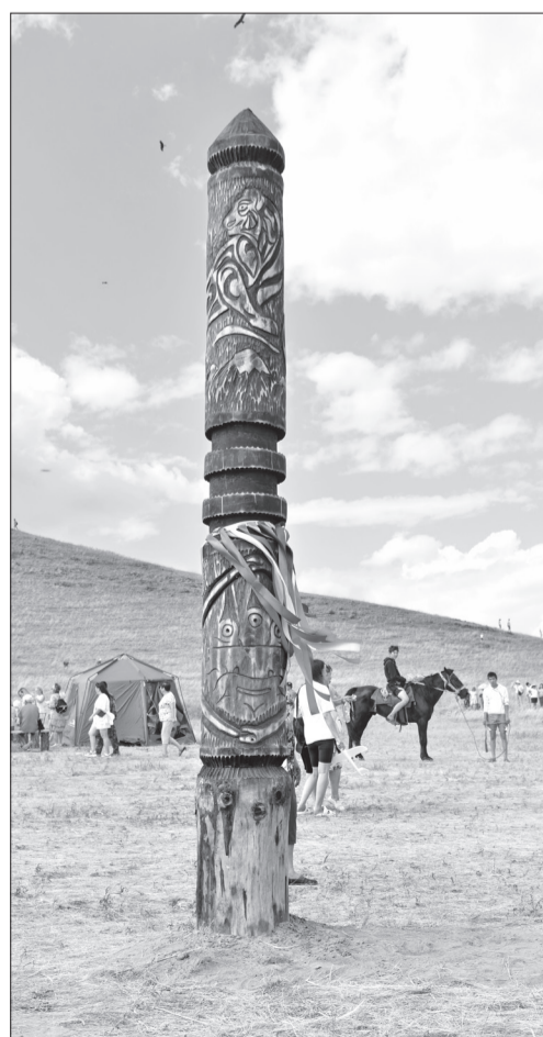
Победитель-сарчын. Работа Игоря Галкина.