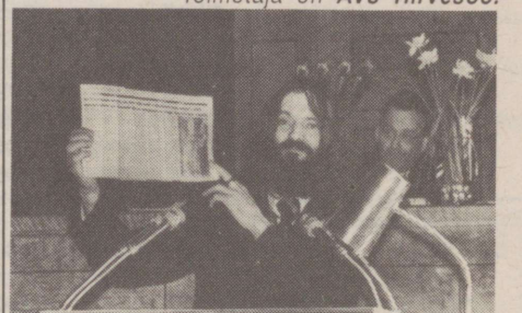
Arvo Pärt Heliloojate Liidu kongressil veebruaris 1979.