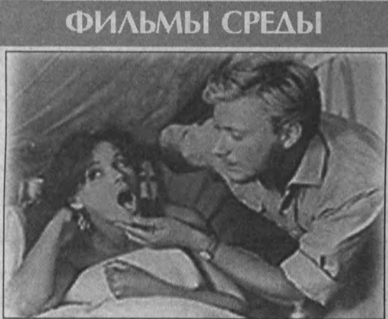
Наталья Фатеева и Андрей Миронов в комедии «Три плюс два».

10.15 «Живая бомба» (США, 1995). Боевик. 31-й канал. 10.55 «Дагон кровожадный» (США — Испания, 2001). Фильм ужасов. 4.