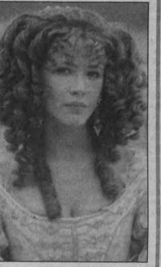
Софи Марсо в драме «Маркиза».

8.15 «Зона высадки» (США, 1994). Боевик. 2-й канал. 8.45 «Дуракам закон не писан» (США, 1997). Комедия. 8.