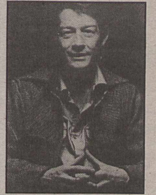
John Hurt leikur aðalhlutverkið í þremur spennumyndum sem verða sýndar þrjá miðvikudaga í röð.

Þrjá miðvikudaga í röð verða á dagskrá Stöðvar tvö spennumyndir sem ganga undir samheiti Hrolltröð. Það er leikarinn góðkunnur John Hurt er leikur aðalhlutverkin í þeim öllum. Í fyrstu myndinni Hefndin (Vengeance) er Peter Chamody á flótta undan mönnum sem ætla að drepa hann. Þegar hann á hóteli einu hittir fyrir hóp fólks sér hann tækifæri til að losna undan þeim er sækjast eftir lífi hans. Í annarri myndinni Frí fyrir þrjá (Holiday For Three) fylgimst við með því þegar miðilsfundur breytist í martröð fyrir þátttakendur og í þriðju myndinni Stuttar nætur (Short Nights) kynnimst við harmleik hjá hjón-