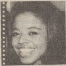
○ Shanice pole Eestis veel käinud.

Saates tihti esinev Shanice on mind inspireerinud juba aastaid. Ta oli 14-aastane, kui temalt ilmus esimene nn. kauamängiv, mis saavutas kohe tormilise edu USAs ja Euroopas. Pärast keskkooli lõpetamist tegi Shanice oma teise CD - "I like your smile", mis tutvustas noort tähte ka Eestis.