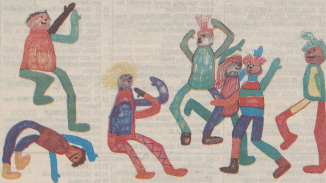
○ Noor Gauguin ei soovinud oma nime nimetada, aga sellegipoolest rõõmus pilt, eks?