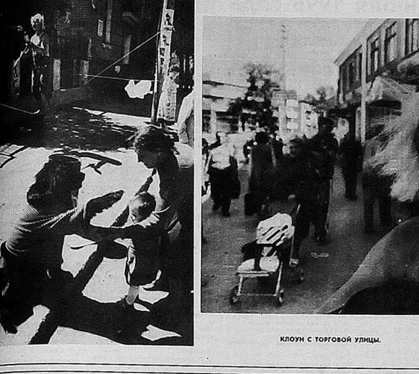
КЛУБЪН С ТОГОВОЙ УЛИЦЫ.