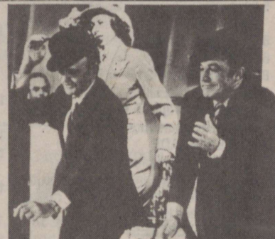
Esiplaanil Fred Astaire ja Gene Kelly tantsuhoos.