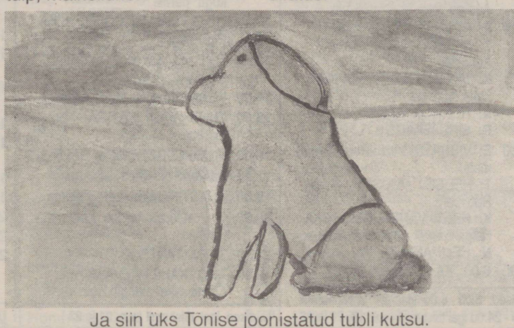
Ja siin üks Tõnise joonistatud tubli kutsu.

roos, kullerkupp, lumikelluke, karikakar, piibeleht, saialill (võib olla ka sinilill), mimoos, tulp, maikelluke.