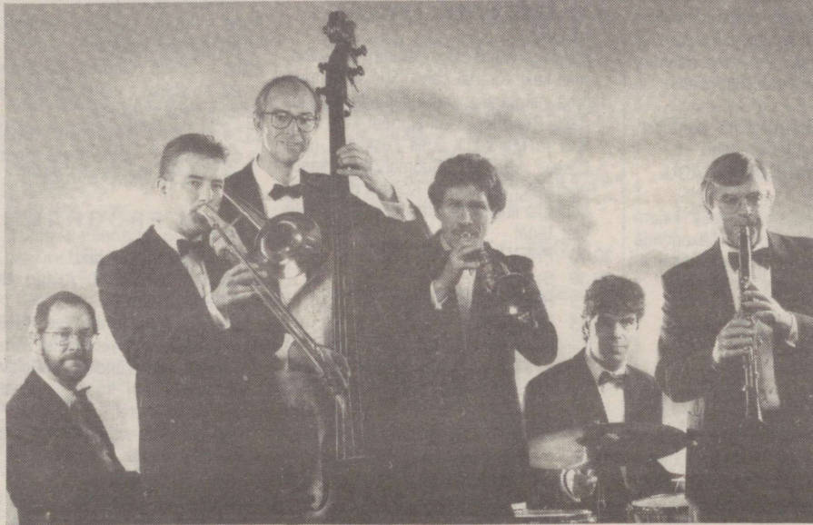
"The Metropole Orchestra"

Kolmapäeval, 12. oktoobril kell 19 kuuleme kontserdi esimest osa, milles esineb Hollandi traditsionaalse džäss ansambel "The Dutch Swing College