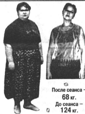
После сеанса — 68 кг. До сеанса — 124 кг.