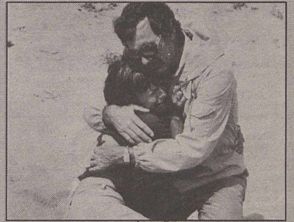
Það gerast heldur betur óvæntir atburðir þegar fjölskyldan fer í útilegu.