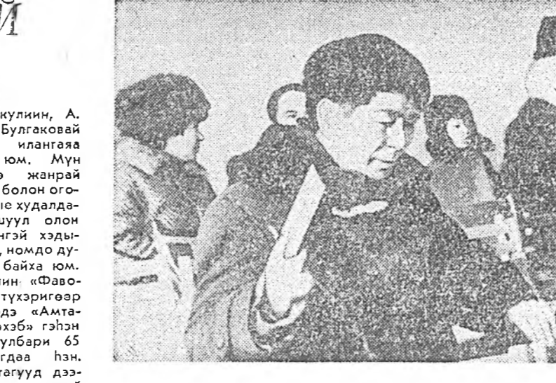
би байгаа һаань, хоёр зууны түүхэригөөр энэ ном һамган даа абаха нэм. Муноо һамгаа наада бариха аргагүй, гэхэ нэгэнэй шоглохо, зал сохид хухих юм.

Хүүлэй үедэ Улаан-Удэ хотын худалдаа наймаанэй эмхидхүүдэй бээ бөөһэй урдилдэн шахуу гэхээр аукционуудыг үнгэрэгдэг боложо байһынь хүн зон мэдэржэ байгаа ёһотой. Хотын номойше магазинууд боложо байһан юумэнүүдээ зохиомлохогүй гэжэ оролддо. Энэ удаа Улаан-Удэи «Эниане» гэхэн номой магазин аукцион үнгэрэгдэ. Номуудыг үнэтэй эсгээр абаха дуратайшуул илалт олоор суглароо гэжэ хэлээ хэрэгтэй. Аукциондо табигдалан 63 номоно турүүшын шатаада 18-н үйлэ. Уадань эдшы номуудын худалдагаа энэ жэлдэ табигдалан А. Кристин,