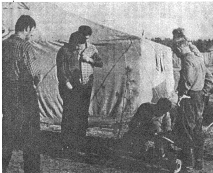
Кроме того, мебели и столярных изделий в 1937 году было изготовлено на 28 тысяч рублей. На террито-

рии района было 2135 лошадей и 2554 головы крупного рогатого скота. Были развиты бондарный промысел и кустарное кирпичное производство. Только общественные посевы сельскохозяйственных культур занимали 170 гектаров.