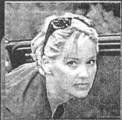
«ПОСЛЕДНИЙ ТАНЕЦ» Семнадцатилетняя девушка

в состоянии аффекта убила двух человек. Приговоренная к смертной казни, она провела в тюрьме целых 12 лет. Молодой адвокат, который начал работать в комиссии по помилованию при губернаторе, занимается делом раскаявшейся в своем преступлении героини.