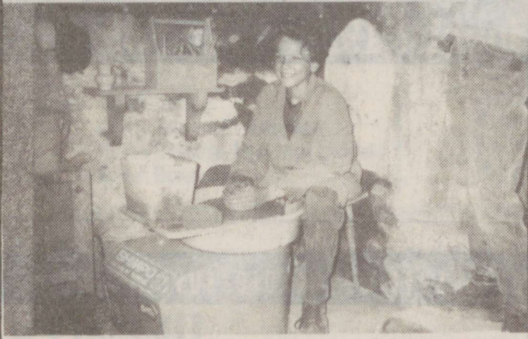
○ Maa ilma kõige särasilmsem noor pottsepp (K.S. väljend).

E 13.05 Šveitsis on väga kirev koolisüsteem, sest seal on mitu keele- ja usupiirkonda. Saate autor Kai Siidritšep tõi RLi toimetuse palvel lagedale oma suurepärase Šveitsi-reisi pildikogu. Võtsime sealte Teile näitamiseks ühe.