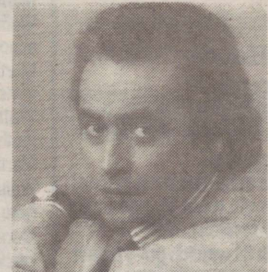
Esinevad maailmakuulsad ooperilauljad.