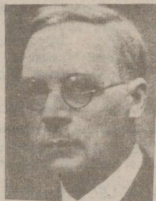
14.45 Teated. Reklaam