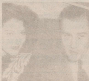
• Ava Gardner ja Artie Shaw