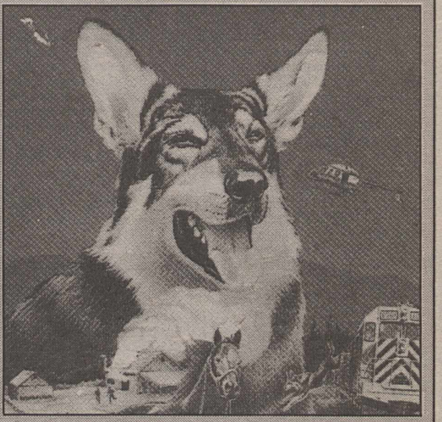
Hundurinn Hobo er húsbóndalaus og því frjáls ferða sinna.