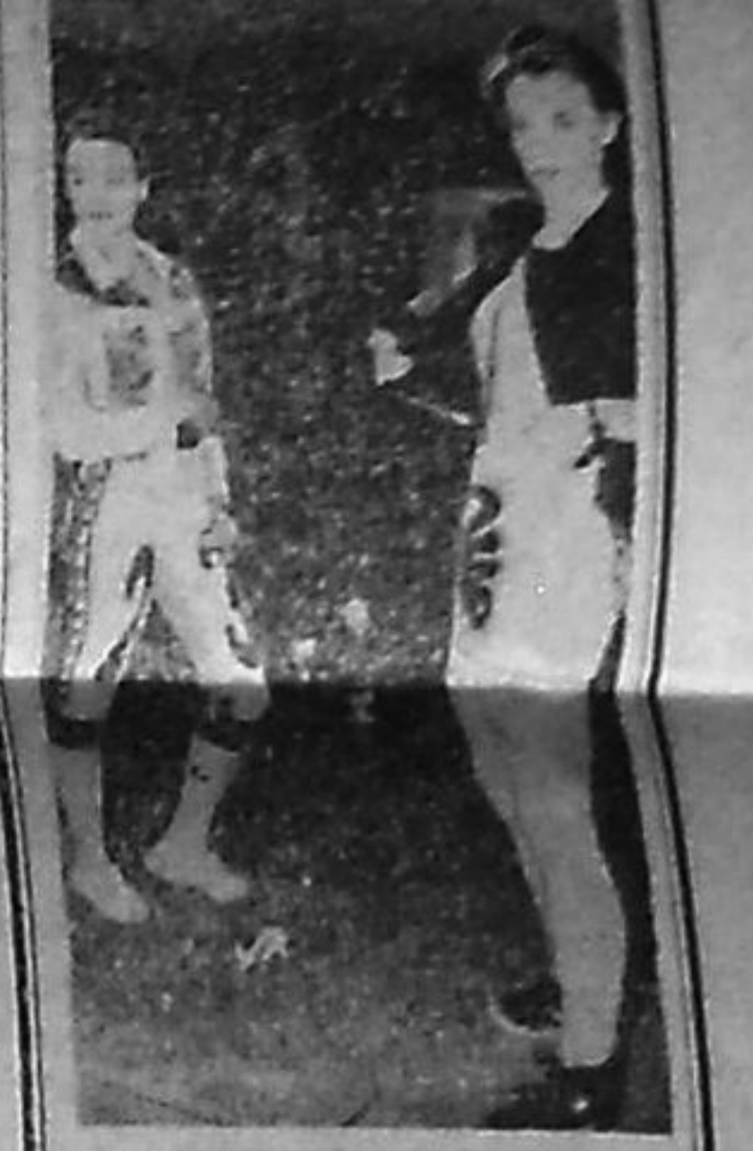
Снимкасонть: певти «Феруччи» коммерческой марксы.

Улить эсенек герой атянок. Улить эсенек герой атянок, Орден Лешниэнь, вай, кантлицяно. Баганань ломанть честнойста трудить, Ленинань знамянь сынь аэрга кандить. Те моронть эрянь содавикс композиторсь ды музыковедсь Н. И. Борркин сермадызе Куйбышевской областень Шанталинской районь Багана велесь. Сонэ морьыз теизэ то сонэ эриятне В. Т. Зайцева ды А. Я. Патакшина.