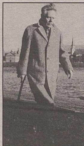
Þórbergur Þórðarson les sjálfur eitt kvæði.