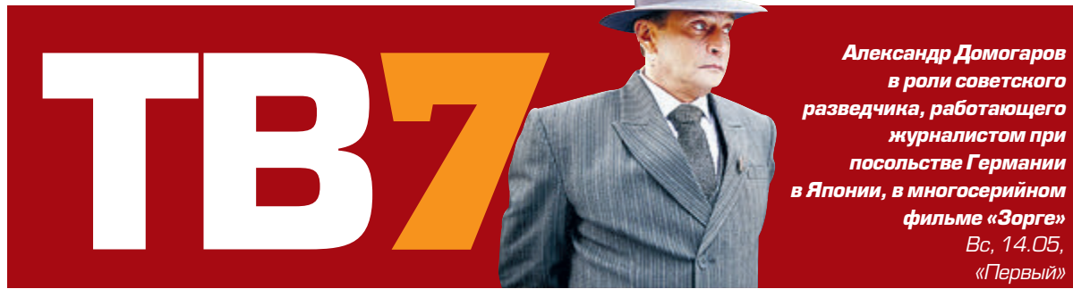
Александр Домогоаров в роли советского разведчика, работающего журналистом при посольстве Германии в Японии, в многосерийном фильме «Зорге» Вс, 14.05, «Первый»