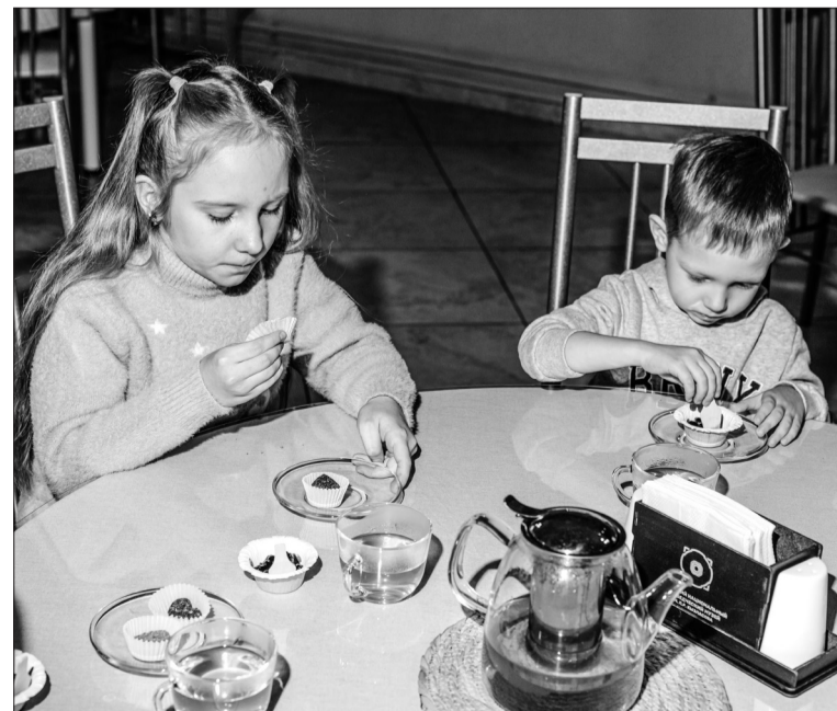
Необычные лакомства детям пришлось по душе.

В следующее воскресенье новая группа детей отправится в увлекательное путешествие в мир национальной кухни и украшений. В красивом и уютном пространстве «Малины Бамбини» ребята ждёт вкусно-познавательный экскурс в культуру и историю родной республики. Гости украсят пряничное пого, узнают интересные факты о хакасах и поиграют в национальные игры.