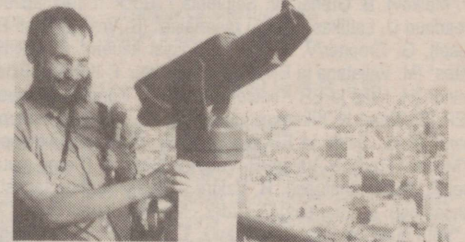
* NUUSTAKU - PARIIS - NUUSTAKU. See pilt on tehtud Pariisis.

Tasapisi lähevad meie saated suve jooksul eestriisse.