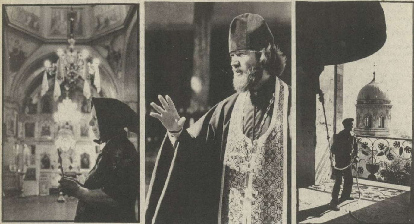
Трудно поверить в то, что по берегам Днестра еще сто лет назад рос строевой лес: сегодня здесь увидишь разве что обрубившиеся перевальские знаки да ржавые скелеты бар.

Трудно поверить в то, что в Молдавии когда-то было больше тысяч православных церквей, два десятка монастырей и скитов. «Церкви — на