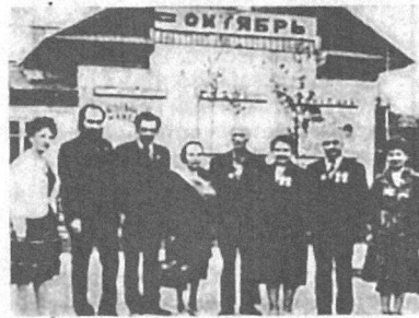
10 ноября 1913 года в Surgute была принята первая телеграмма по проволочному телеграфу.

7 ноября 1951 года был открыт первый специализированный кинотеатр в Surgute. Он назывался «Октябрь». Кинотеатр снесен в конце 1988 года.