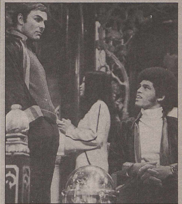
John Saxon leikur slagsmálhund sem kemur Bruce Lee til hjálpar í lokin.