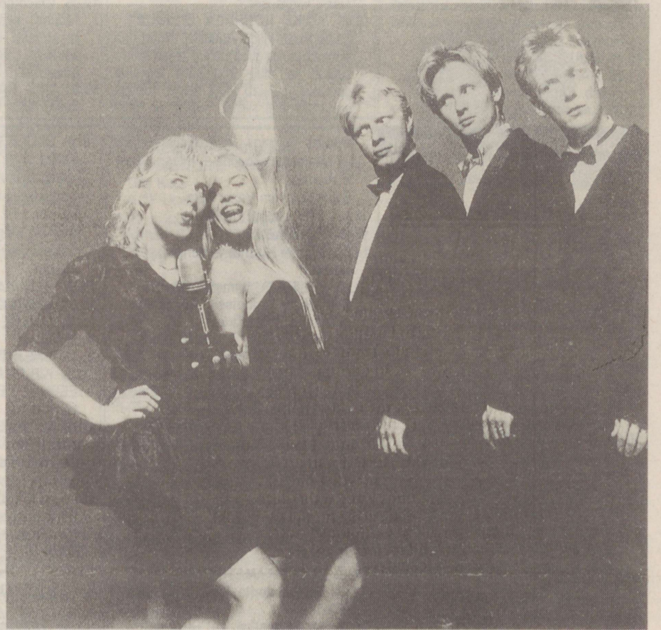
Džässifestivalil esinejaid - "The Real Group"

Eesti Raadio on festivali esinejaid tutvustanud juba rohkem kui kuu aja jooksul. Hea meel on ka sellest, et raadiokuulajad löid aktiivselt kaasa kahe nädala jooksul "Jazzkaare" viktoriinides, kus esitasime küsimusi nii eesti festivalide, džässmuusikute kui ka maailma džässi suurnimede kohta. Õige vastus leiti enamasti juba esimese korraga. Iga õige vastus, neid oli üle viiekümne, pälvis ka väikese