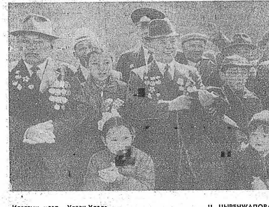
Илалтын үдэр Улаан-Үдэдэ. Ц. ЦЫРЕНЖАПОВАЙ архиваа.