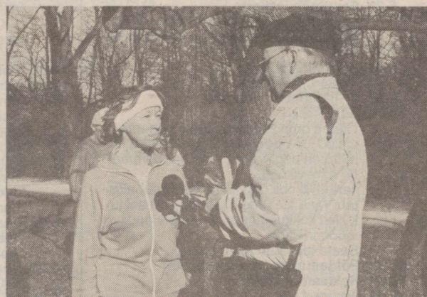
* Vahetud muljed mikrofonil!