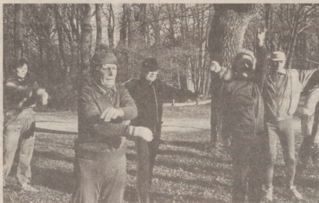
* Jooksu juurde kuulub ka voimlemine.