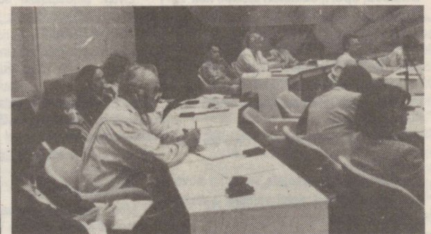
○ Pilk Valgesse saali