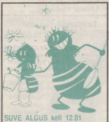
SUVE ALGUS kell 12.01