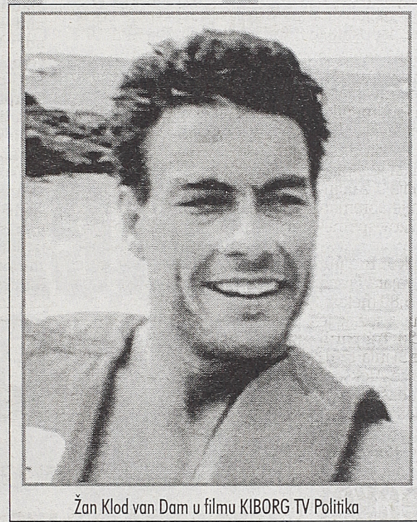
Žan Klod van Dam u filmu KIBORG TV Politika