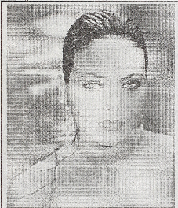
Ornela Muti u filmu OSKAR JE KRIV ZA SVE TV Politika