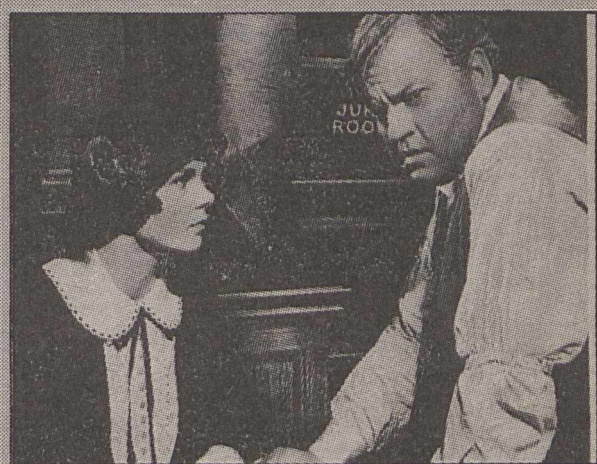
Kvikmyndin Þráhyggja er byggð á hinu þekktu Leopold-Loeb máli.