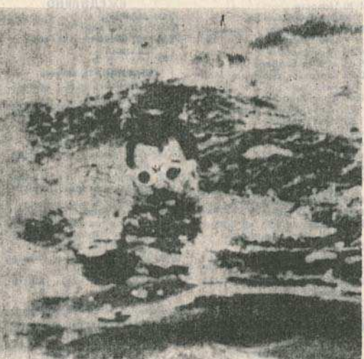
На снимках: вверху: заплыв начался; внизу: Розз Хендрикс после заплыва.