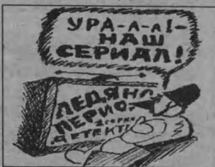
Рис. В. СТАРАДЫМОВА.

«ПЕРВЫЙ КАНАЛ» 6.00 Новости. 6.10 «В поисках золотого руна». Х/ф.