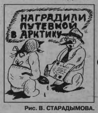
Рис. В. СТАРАДЫМОВА.

НТН-12 9.30 «Победоносный голос верующего».