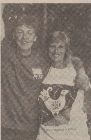
• Paul ja Linda McCartney

Eriti hästi tundis Paul end oma "rohelistes taevast" pärast seljataha jäänud maailmatuuri, mille ta pärast 13 aastast vaheaega taas ette võttis. Reisi jooksul ta 13 riigis 2,8 miljonile inimesele - ja sissetulekust andis ta tohtu summa riigimaksudeks. Esimene asi, mida ta reisilt tulles tegi, oli pikk jalutuskäik oma valdustes. Kõik oli korras, tema lambad olid oma eluga rahul, sest muidugi on Paul palganud oma farmi abiks inimesed, kes seda tööd tunnevad. Tema ja ta perekond - naine Linda ja lapsed (13aastane James, 18aastane Stella, 21aastane Mary ja 26aastane Heather) - on nüüd