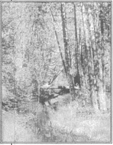
В рамках проводимого совещания в выставочном

зале краеведческого музея организуется выставка печатной продукции «Югорский книжный мир», где будут экспонироваться книги, буклеты, календари и другие виды издательской продукции городов и районов округа.