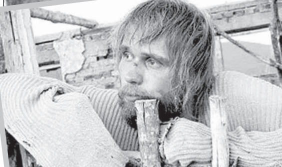
В фильме «Карусель» познал тяготы чеченского плена.

жет были там терять никогда не получали больших денег. В театре можно работать только из большой любви к нему.