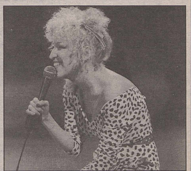
Bette Midler er í miklum ham í Divine Madness.