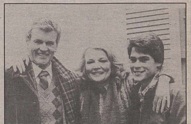
Don Murray, Gena Rowlands og Rob Lowe leika aðalhlutverkin í Meðan vonin lifir.