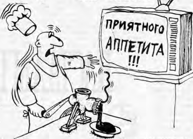
Малюнок Максіма МАЛЫШАВА

19.00, 22.00 Вести. 19.20 Праздник каждый день. 19.30 Телеигра "Лого". 19.55 Фестиваль "Сан-Вин-сент-92". 20.45 "Школа драматическо-го искусства" Анатолия Ва-сильева. Часть 1-я. 22.20 Из зала Конституцион-ного суда России. 22.35 На сессии ВС Россий-ской Федерации. 23.05 "Школа драматическо-го искусства" Анатолия Ва-сильева. Часть 2-я.