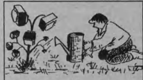
Рис. В. СТАРАДЫМОВА.

МузТВ 8.00, 9.00, 10.00, 11.00, 12.00, 13.00, 14.00, 15.00, 16.00, 17.00, 18.00, 19.00, 20.00, 21.00, 22.00, 23.00, 0.00, 1.00, 2.00, 3.00, 4.00, 5.00, 6.00, 7.00 «Pro-новости».