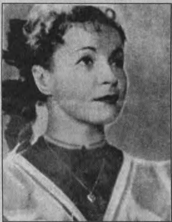
Вера Маречкая в киноповести «Сельская учительница».

8.00 «Ошибка Тони Вендиса» (СССР, 1981). 1-я серия. Детектив. 6-й канал. 10.30 «Отрыв» (США, 1971). Трагикомедия. 49.