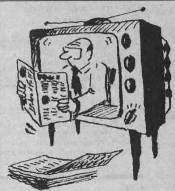
Рис. Виктора СТАРАДЫМОВА.

10.30 «Странствия Саливана» (США, 1942). Комедия. 49. 10.30 «Взрыватель» (США — Гонконг, 1998). Приключенческий боевик. 12.