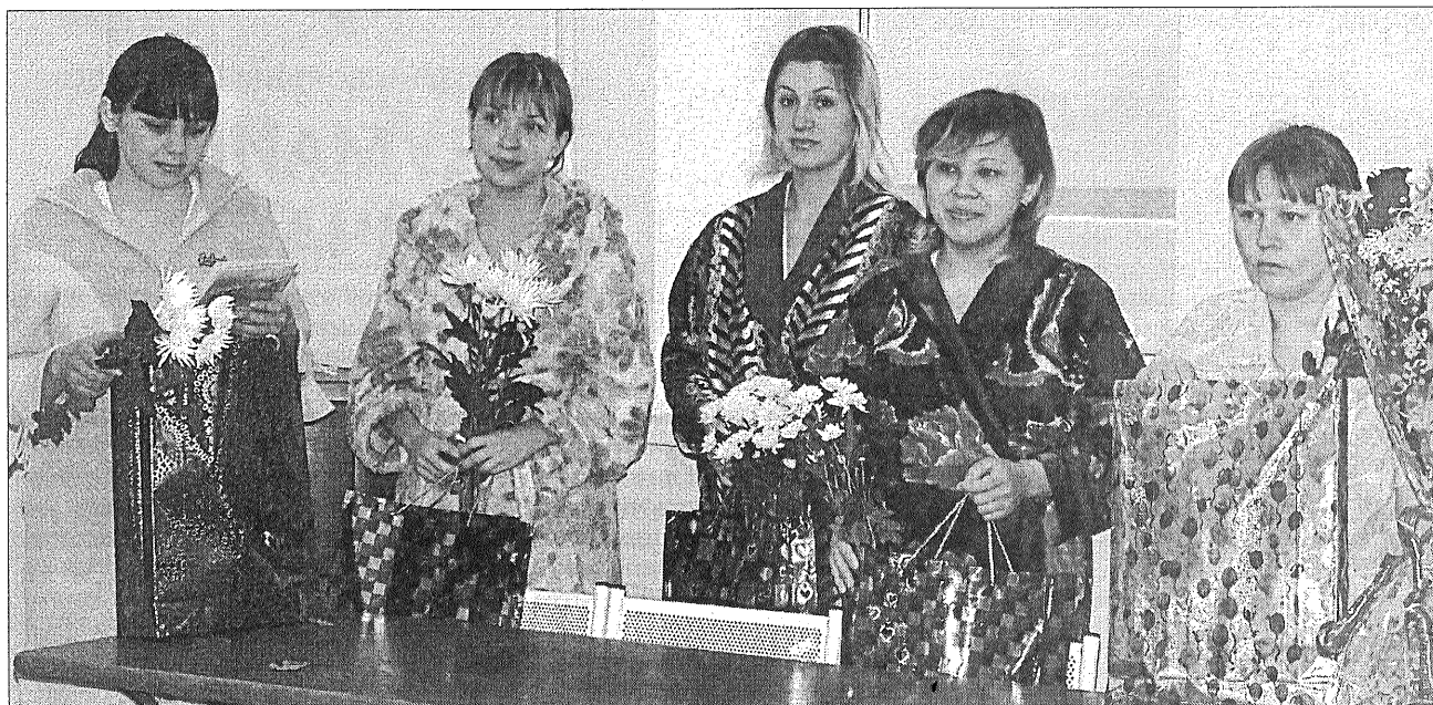
Для молодых мам поздравление стало неожиданностью.

Праздник мам - особенный. В этот день в родильном отделении Салехардской окружной больницы поздравляли тех, кто мамой стал совсем недавно.