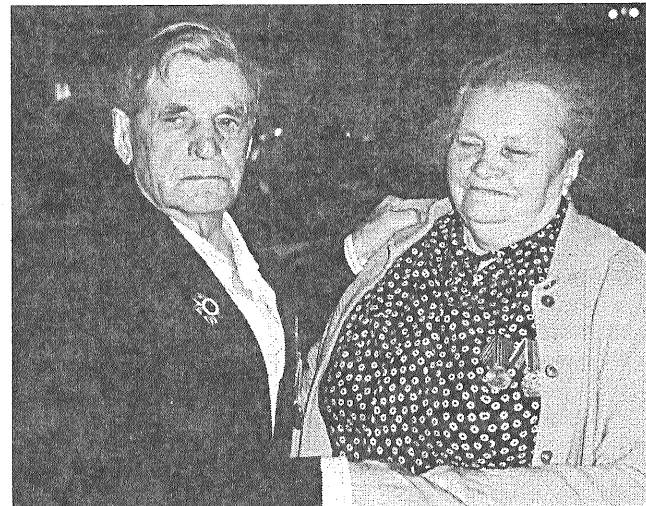
Семья Овчаровых отмечает День Победы.