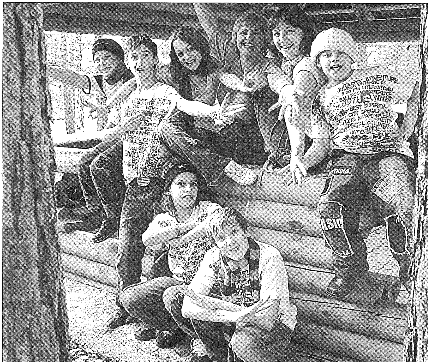
Команда "Впервые" попробовала играть и сразу победила.