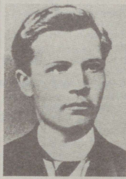
JUHAN LIIV 130