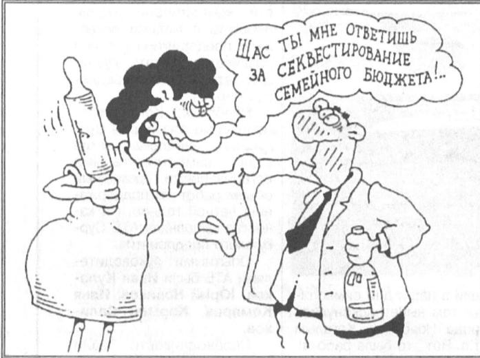
Рисунки Игоря Кийко