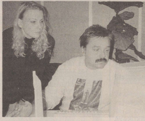
Hetked Eesti Raadiost aasta lõpul jätkuvad järgmises lehes.