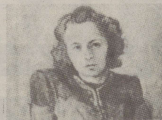
Fragment Gustav Raua õlimaalist (1941).