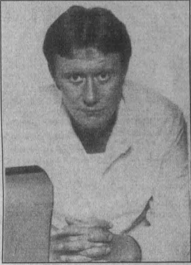
Андрей Миронов, «Соломенная шляпка», водевилль.

10.00 «Соломенная шляпка» (СССР, 1974). 2 серии. 10.30 «Критическая масса» (США, 2000). Боевик. 31.