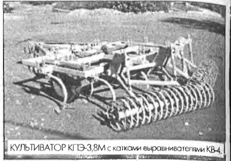
КУЛЬТИВАТОР КПЭ-3,8М с катками выравнивателями КВ-4.

3,8 М с КВ-4 повышает урожайность полей на 2-4 ц. с гектара (данные по пшенице).